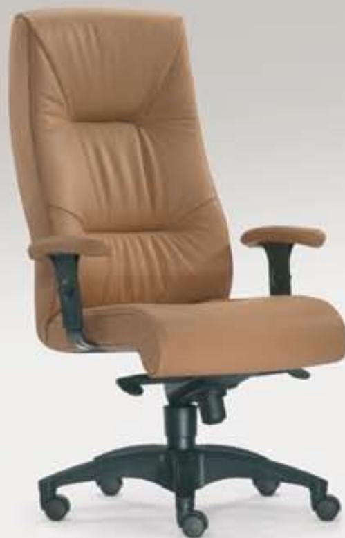
TURBO 2 Komfortsessel Hochlehner mit Synchron-Mechanik