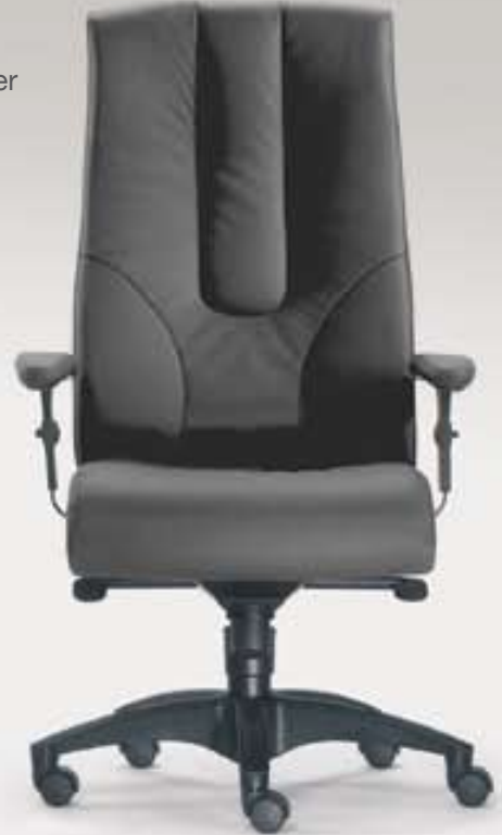
TURBO 1 XXL Komfortsessel Hochlehner mit XXL-Mechanik