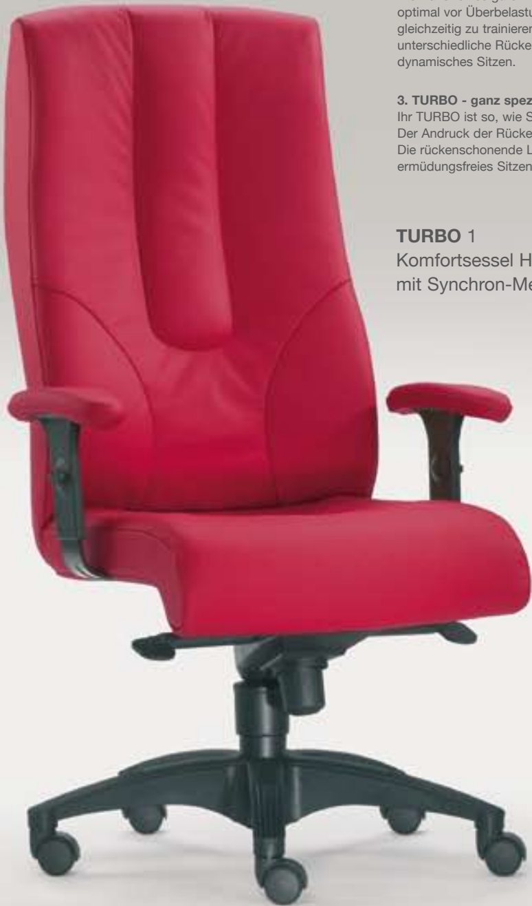
TURBO 1 Komfortsessel Hochlehner mit Synchron-Mechanik

Ihr TURBO ist so, wie Sie ihn haben möchten. Er passt sich Ihrem Körper an: Der Andruck der Rückenlehne lässt sich auf Ihr Körpergewicht einstellen. Die rückschonende Lehne sowie der bequeme Bandscheibensitz ermöglichen ermüdungsfreies Sitzen.