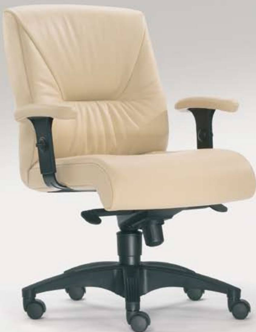
TURBO 3 Komfortsessel Halblehner mit Synchron-Mechanik

Der robuste Wohlfühlsessel mit bequemer und ergonomischer Polsterung und weicher höhenverstellbarer PU-Armlehne macht das Sitzen am Arbeitsplatz zu einem wahren Sitzerlebnis.