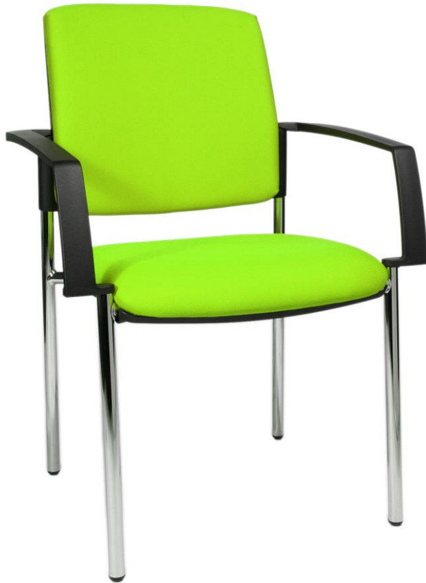
Abb. in BB190A G05