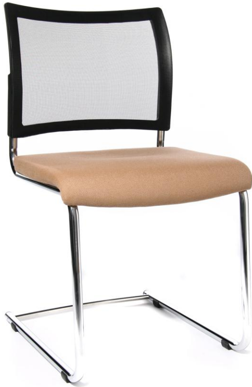
Abb. in Bezug G07