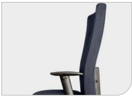
Rückenlehne und Sitz in Farbe Dossier et assise en coloré