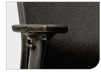
Arretierbare 4D Auflagen Dessus d'accoudoir 4D bloquables