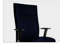
Rückenlehne und Sitz in farbigem Kunstleder Dossier et assise en similicuir coloré