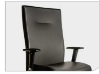
Rückenlehne und Sitz in Kunstleder Dossier et assise en similicuir