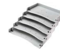
Schrägablagen, 5er Set ACSA