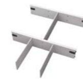
Trennsteg, 1 Set ACTR